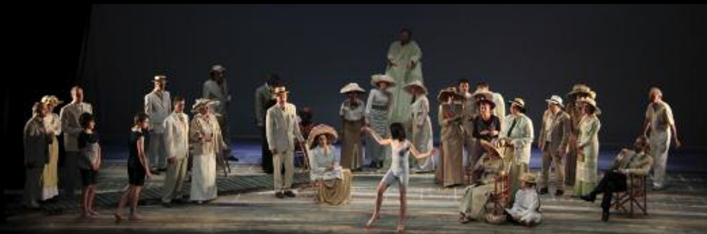
En 2018, Orfeo Photo Ben Loy